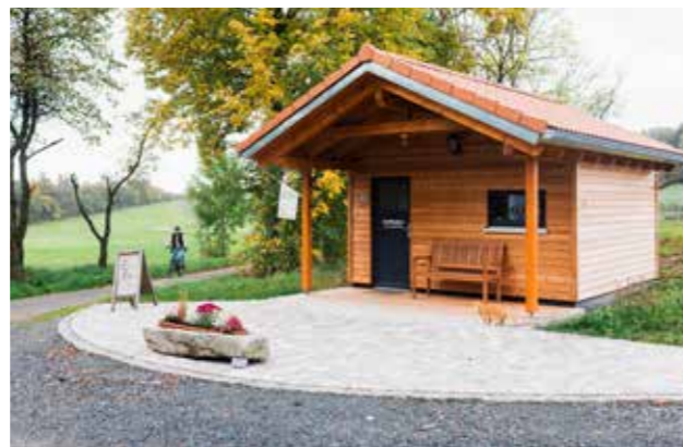
Das SB-Haisl auf dem Bio-Betrieb der Familie Koschta-Würstl in Unterwappenöst.