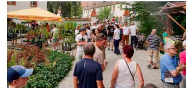
Bio-Meile 2024 auf Schloss Wolframshof in Kastl

Die Planungen für die Bio-Meile 2026 haben bereits begonnen. Freuen dürfen sich die Gäste auf ein vielfältiges Angebot, regionale Bio-Spezialitä-