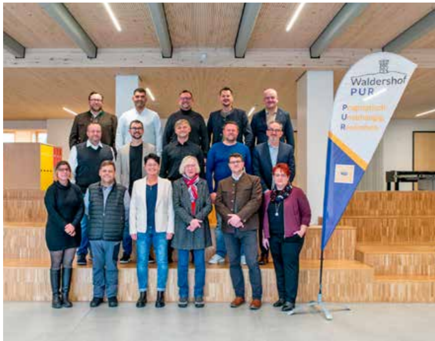
Diese 16 Kandidaten stehen auf der Liste von Waldershof Pur zur Wahl.

Unabhängiger Verein stellt 16 Kandidatinnen und Kandidaten vor und sammelt erfolgreich Stützunterschriften